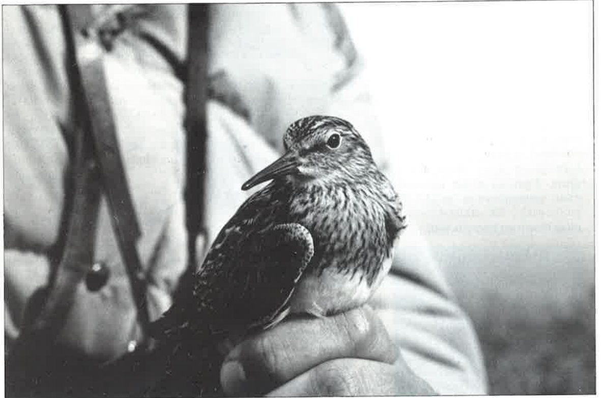
Alaskansirri tavattiin Norrskärillä.

selkälokin alalajeista ja urpiaisien *cabaret -alalajista. Taskujen ja mongoliantyllin osalta käsittelyn hitaus johtuu yksinkertaisesti lajin määrittämisen vaikeudesta. Joissakin tapauksissa on lisäksi jouduttu turvautumaan ulkomaiseen asiantuntija-apuun, mikä osaltaan edelleen hidastaa havainnon käsittelyä. Selkälokin alalajien osalta havaintojen käsittelyä vaikeuttaa tiedon puute. Maamme itäpuolella pesivän vaaleaselkäisen heuglini -alalajin tuntomerkit ja yksilöiden välinen muuntelu ovat vielä hämärän peitossa. Urpiaisien cabaret -alalajin hyväksymiseen vaadittavat vähimmäistuntomerkit ovat vähitellen selviämässä, mutta havaintojen käsittelyssä ei ole ehditty vielä niin pitkälle, että ne olisi voitu julkaista tässä katsauksessa. RK toivoo, että cabaret-urpiaisien dokumentoidaan edelleen huolellisesti tarkoin mittauksin ja valo-