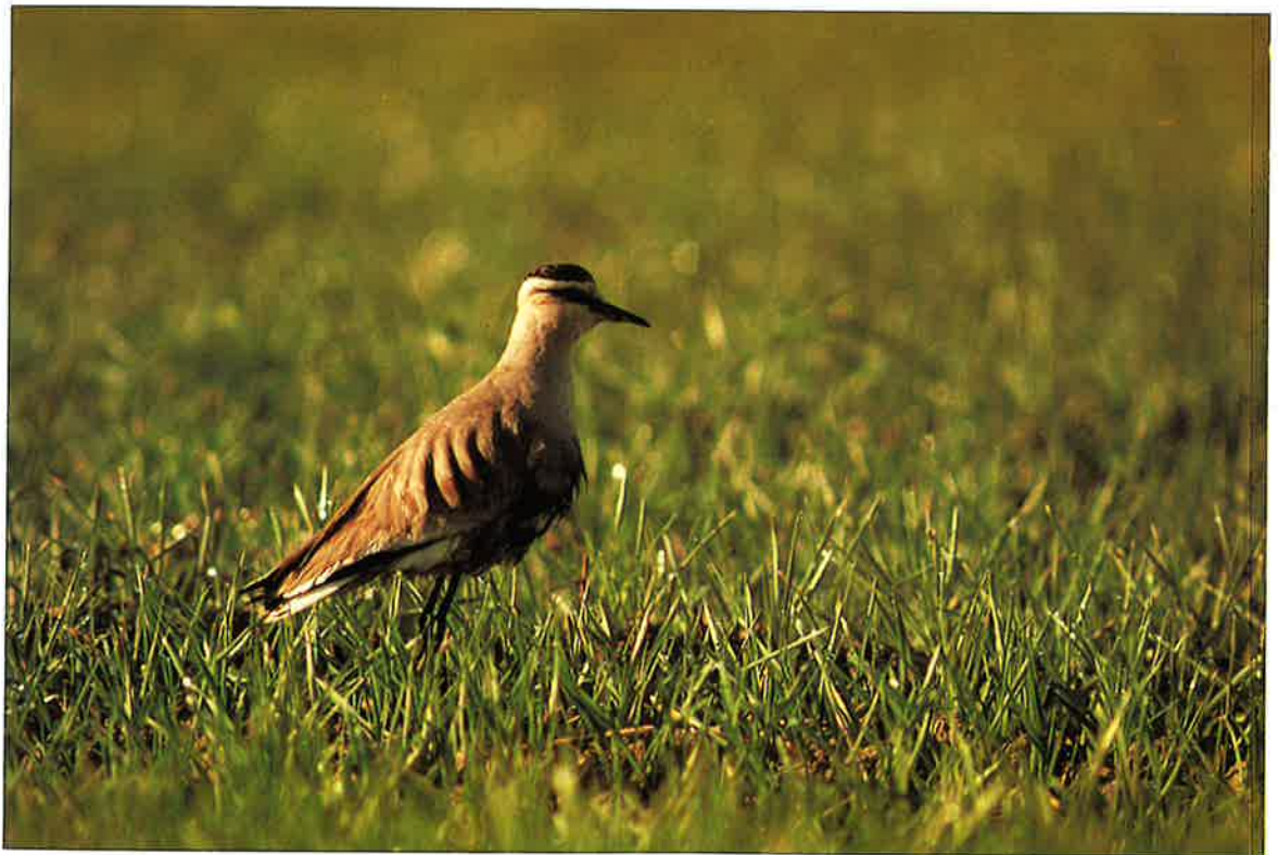
Arohyppä oli vuoden jännittävimpiä havaintoja.