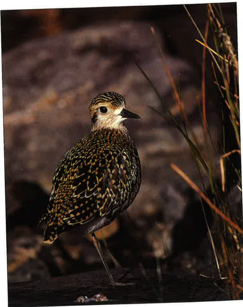
Siperiankurmitsa vieraili 15.-22.9. Närpiössä.