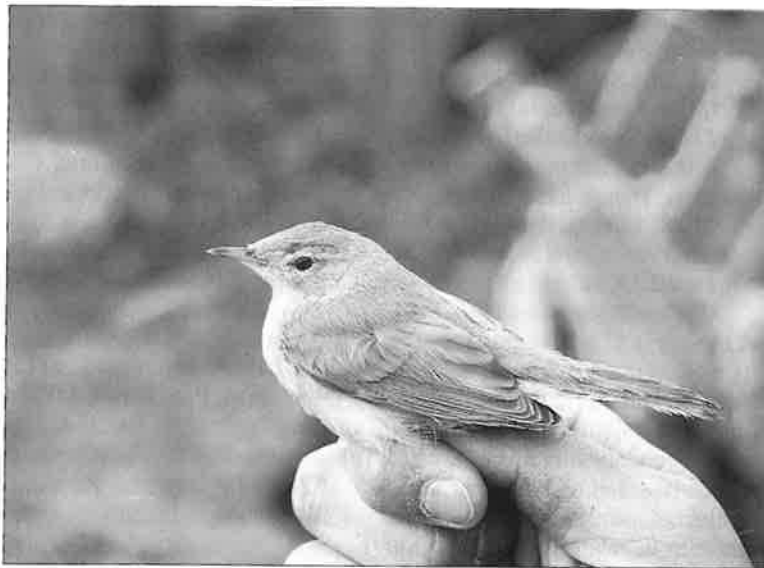
Norrskärin pikkukultarinta on toinen, syksyllä maassamme tavattu

Vuoden 1988 yksilömäärä nousee 30:een ja vuoden 1989 yksilömäärä 47:een.