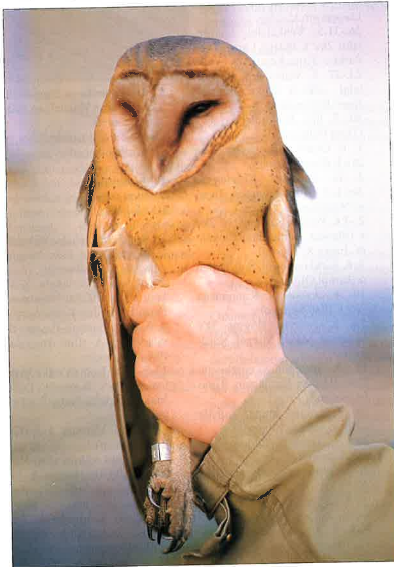
"Surullisen hahmon ritari" - Lämskärlin tornipöllö - koki kovan kohtalon.

15. 5. Ylämaa, Hujakkala n (Ari Lehtinen).