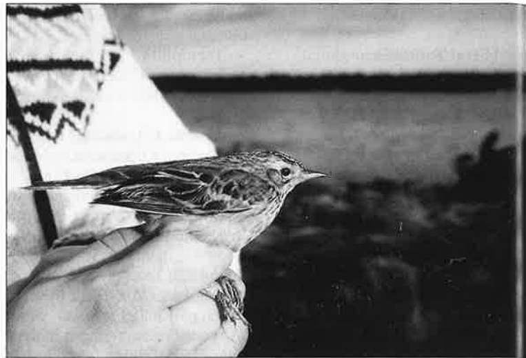
Mongoliankirvinen ilmaantui Suomeen kuudennen kerran.