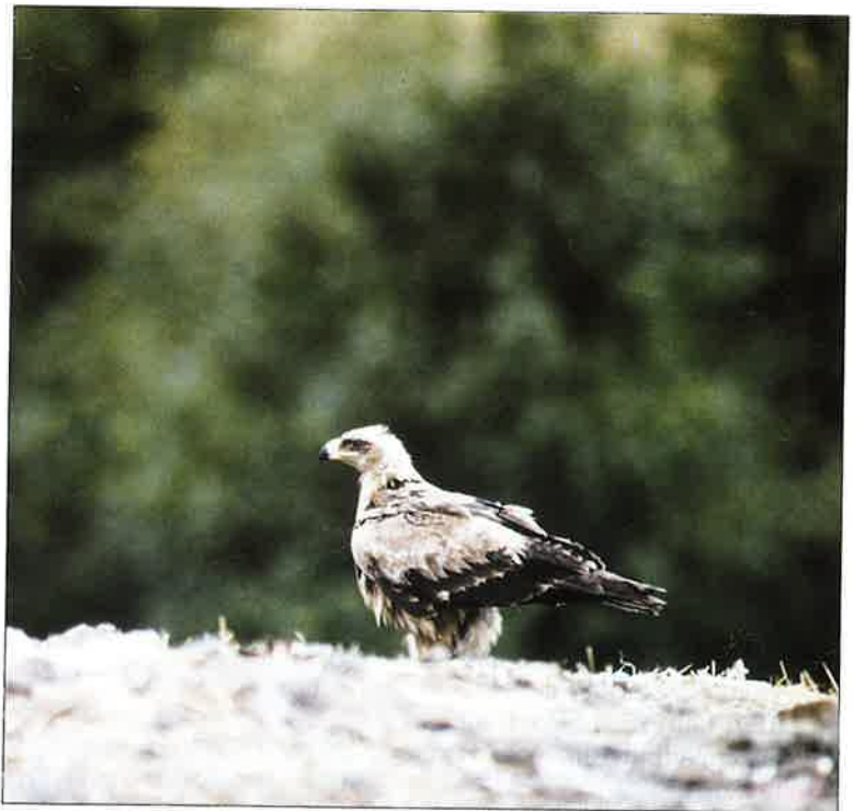
Arokotka Topinojan kaatopaikalla.