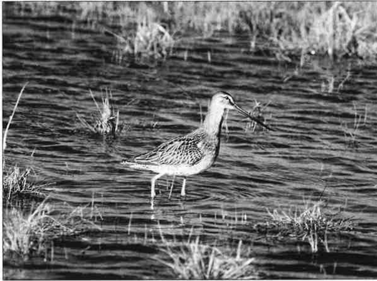
Pitkänokkakurppelo tavattiin Yyterissä jo toista kertaa.