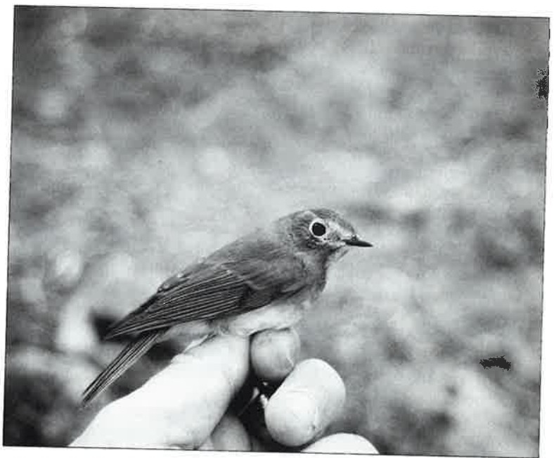
Sinipyrrstö ilahdutti runsaalla esiintymisellä - löytyipä toinen varmis- tettu pesintäkin. Kuvassa naarasyksilö.

Vuoden 1991 alusta alkaen RK ei enää tarkista havaintoja partatiaisesta. Syinä tähän ovat lajin voimakas yleistyminen, joka varmasti laskee ilmoitusaktivi- teettia ja lajin helppo tunnetta- vuus. RK jättää paikallisten har- vinaisuuskomiteoiden ja -toimi- kuntien itsensä päätettäväksi sen, tarkistavatko ne tulevaisuudessa alueellaan tehdyt partatiasha- vainnot vai eivät.