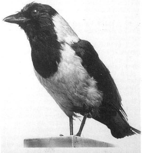
Siperiannaakka ( Corvus dauuricus ), Helsingin Yliopiston kokoelmat.

Karimetso Phalacrocorax aristotelis . 19. — 20. 12. 1949 Helsinki (OF 31:54). Linnun näkivät monet. Saadut kuvaukset olivat suppeita