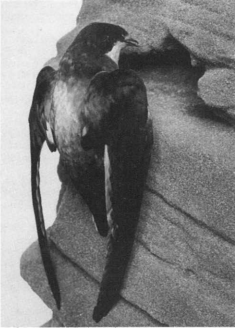
Piikipyrstöpäsky ( Hirundapus caudacutus ), Helsingin Yliopiston kokoelmat.

Valkosiipikiuru M. leucoptera . 9. 6. 1971 Raippaluoto.